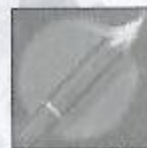
Missile niveau 1